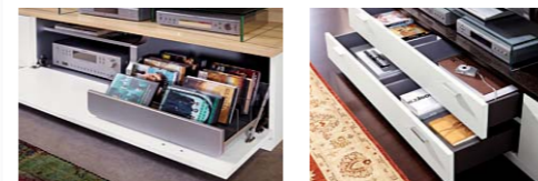
DURCHDACHTE MEDIEN-LÖSUNGEN: Hinter der Techniklappe verbergen sich praktische Schöbkkarten und Stauraum.